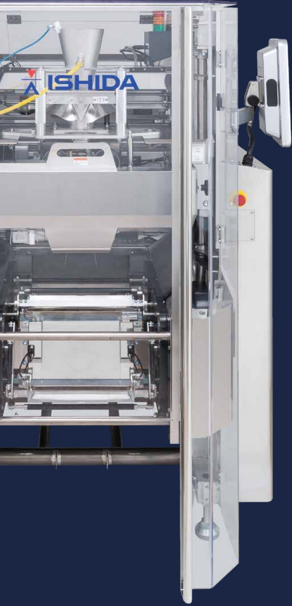
Envasadora para Productos Snacks