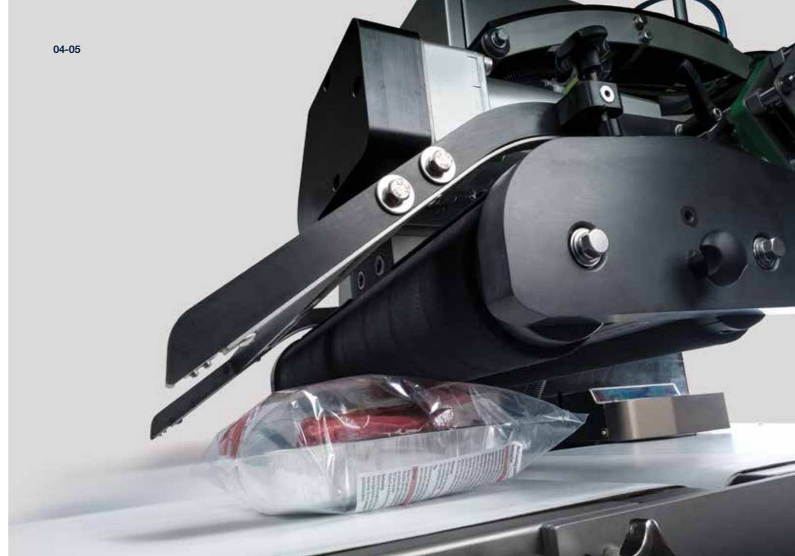
Bolsas tipo pouch