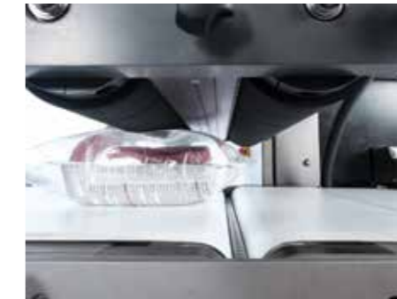
Opción de sensor inferior