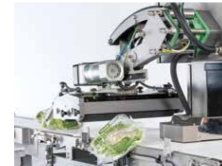
Opción de rechazo por expulsión