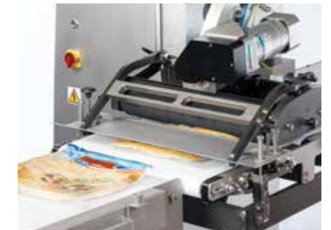
Opción de placa para compresión previa