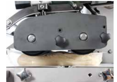
Compresión del envase para expulsar gases MAP