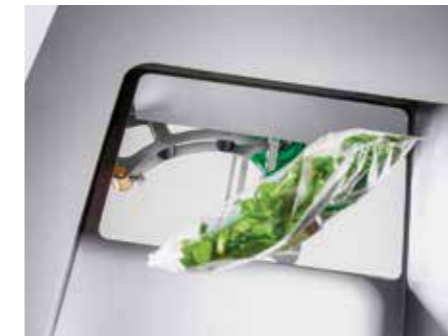
Rechazo por aire estándar