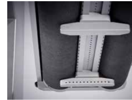
Opción de sensor lateral